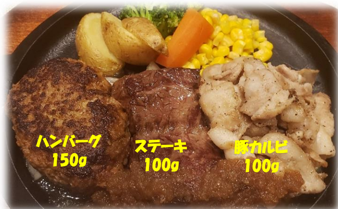
Bigコンボ350g (豚カルビ) セット