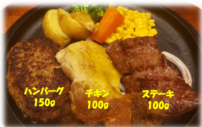
Bigコンボ350g (チキングリル) セット