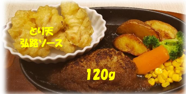
自家製ハンバーグ&とり天セット