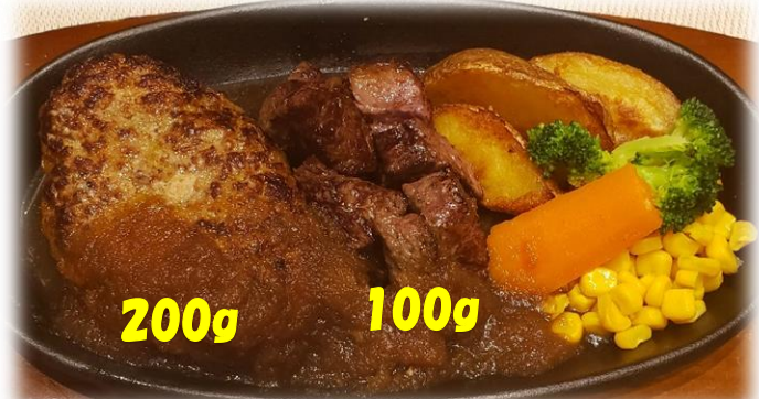
Big自家製ハンバーグ&サイコロステーキセット