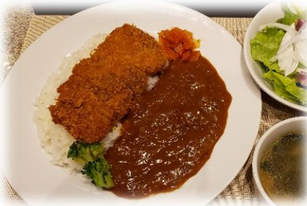
弘路特製 ロースかつカレー