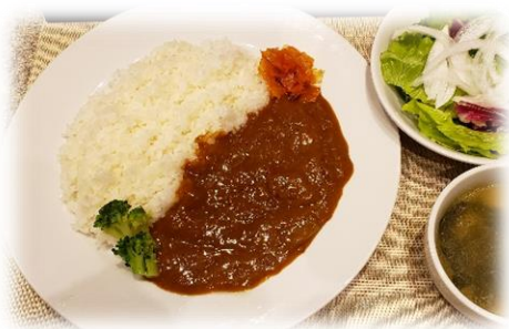
弘路特製 ビーフカレー