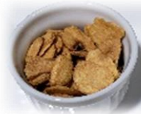
フライドガーリック