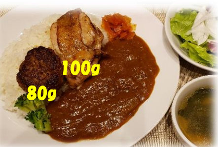
弘路特製 ハンバーグ& チキングリル カレー