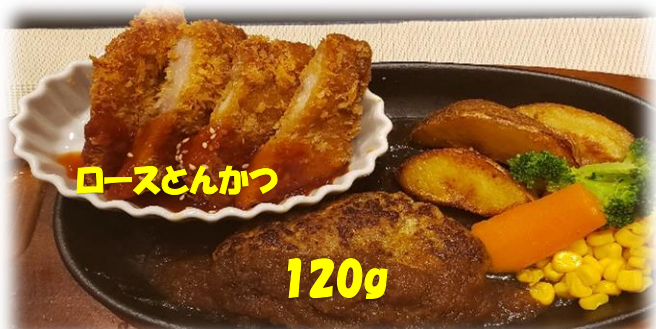
自家製ハンバーグ&ローズかつセット