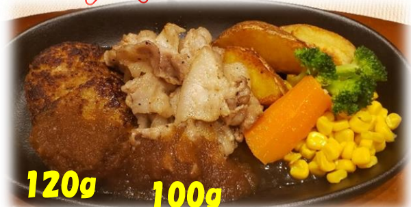
自家製ハンバーグ&豚カルビセット