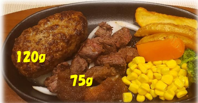
自家製ハンバーグ&サイコロステーキセット