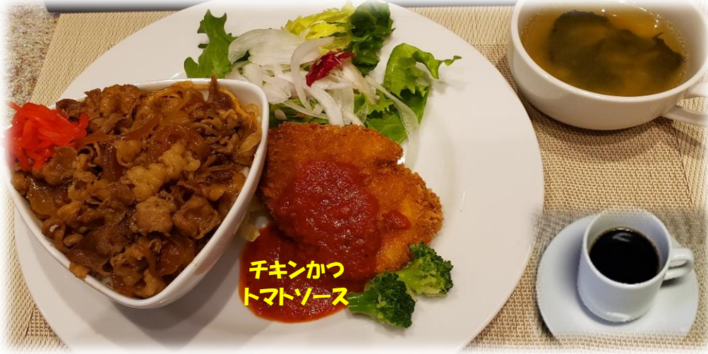
チキンかつ トマトソース