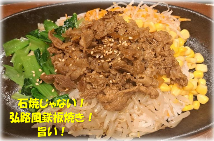
石焼じゃない! 弘路風鉄板焼き! 旨い!