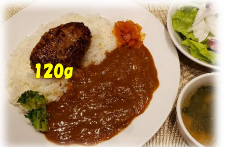
弘路特製 自家製 ハンバーグ カレー